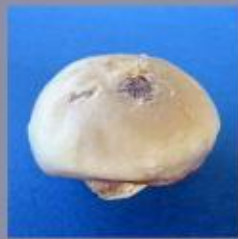
De beschadigde heupkop in werkelijkheid. De heupkop is vervormd en beschadigd.