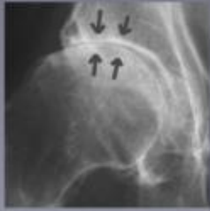
Radiografie van de heupartrose. Het kraakbeen is volledig verdwenen en de gewrichtsploet is niet meer zichtbaar.