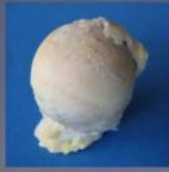
De beschadigde heupkop in werkelijkheid. Er is op bepaalde plaatsen nog een dunne laag kraakbeen, de heupkop is hier nog niet vervormd.