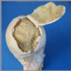
De beschadigde heupkop in werkelijkheid. Het kraakbeen is nog dik en stevig maar het onderliggende bot is afgestorven.