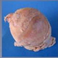
De beschadigde heupkop in werkelijkheid. Het kraakbeen is verdwenen en het bot ligt bloot. De vervorming van de kop is duidelijk zichtbaar.