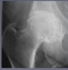
Radiografie van de heupartrose. Het beschadigde kraakbeen wordt steeds dunner waardoor de gewrichtsploet bijna verdwijnt.