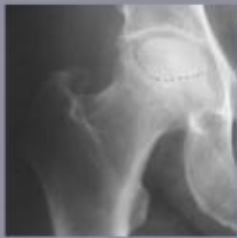
Radiografie van een afgestorven deel van de heupkop. Het kraakbeen is nog intact maar het onderliggende bot is afgestorven.