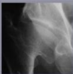
Radiografie van de heupartrose. De kraakbeensdijktage is een gevolg van een aangeboren heupvorming.