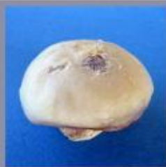
De beschadigde heupkop in werkelijkheid. De heupkop is vervormd en beschadigd.