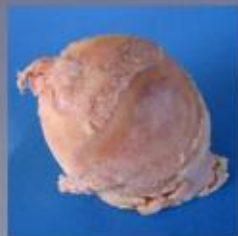
De beschadigde heupkop in werkelijkheid. Het kraakbeen is verdwenen en het bot ligt bloot. De vervorming van de kop is duidelijk zichtbaar.